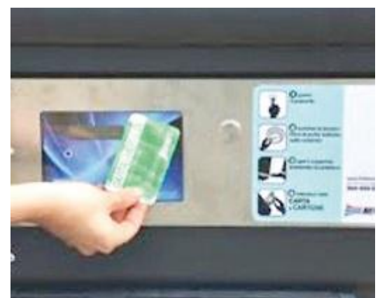
Da fine febbraio entrerà in vigore il nuovo sistema di raccolta dei rifiuti

viale Broccoli 60; mercoledì 12 due nuove repliche alle 18 e alle 20,30 alla Bocciofila di viale Terme 740. Si può partecipare a qualunque assemblea, indipendentemente dalla zona di residenza. Nel corso delle serate saranno in visione anche i nuovi contenitori. Ai residenti delle tre aree artigianali/industriali e ai titolari delle attività che vi hanno sede è dedicata l'assemblea che si terrà giovedì 14 alle ore 20,30 alla Bocciofila in viale Terme 740.